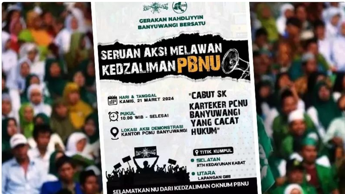
(Seruan ajakan demo yang beredar)

Ajakan demonstrasi tersebut sudah menyebar melalui media sosial dan player di grup-grup WhatsApp pengurus ranting dan MWC NU. Dari informasi di internal PCNU Banyuwangi demisioner, terbitnya Surat Pengesahan Pengurus Besar Nahdlatul Ulama (PBNU) nomor 311/PB.01/A.II.01.45/99/03/2024 tentang penunjukkan Karteker PCNU Kabupaten Banyuwangi dinilai cacat prosedur dan janggal.