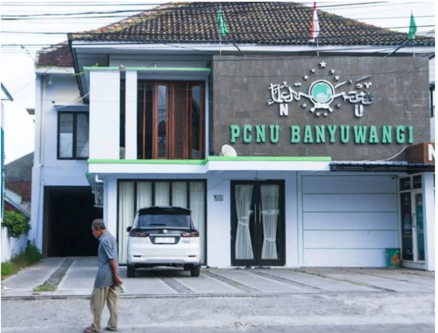
Kantor PCNU Banyuwangi

BANYUWANGI - Terbitnya SK kepengurusan karteker PCNU Banyuwangi menuai pro dan kontra di kalangan warga Nahdliyin Banyuwangi. Pihak kontra karteker bahkan berencana melakukan aksi penolakan putusan PBNU di kantor PCNU Banyuwangi pada Kamis 21 Maret 2024 mendatang.